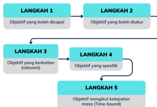
Rajah 3: Model Objektif Pembelajaran

Rajah 3 pula memaparkan struktur model bagi konstruk objektif pembelajaran berdasarkan keutamaan yang perlu dilakukan berdasarkan undian ( voting ) panel pakar dengan menggunakan Interpretive Structural Modeling (ISM)