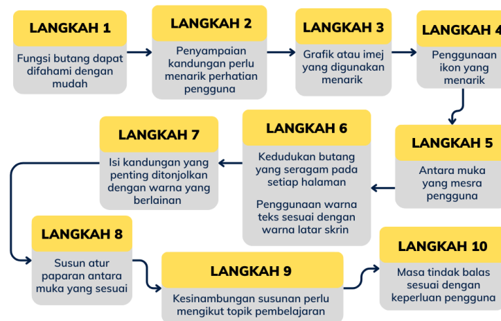
Rajah 5: Model Susunan Paparan Antara Muka Aplikasi

Konstruk seterusnya adalah konstruk susunan paparan antara muka aplikasi. Rajah 5 menunjukkan keutamaan dan susunan struktur yang perlu diimplementasi dalam membangunkan model My Arabiy Game-X.