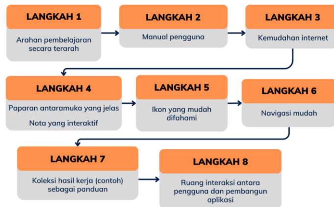
Rajah 2: Model Keperluan Guru

Rajah 2 pula memaparkan struktur model bagi konstruk keperluan guru yang perlu diutamakan oleh pengguna secara turutan berasaskan undian ( voting ) panel pakar dengan menggunakan Interpretive Structural Modeling (ISM)