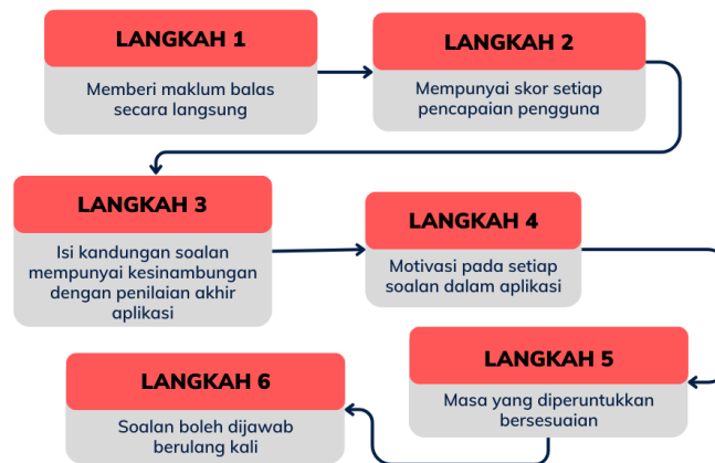
Rajah 7 Model Penilaian Hasil Pembelajaran

Konstruk yang terakhir di dalam model My Arabiy Game-X ini adalah konstruk penilaian hasil pembelajaran. Rajah 7 menunjukkan keutamaan yang perlu diberi perhatian oleh pembangun model.