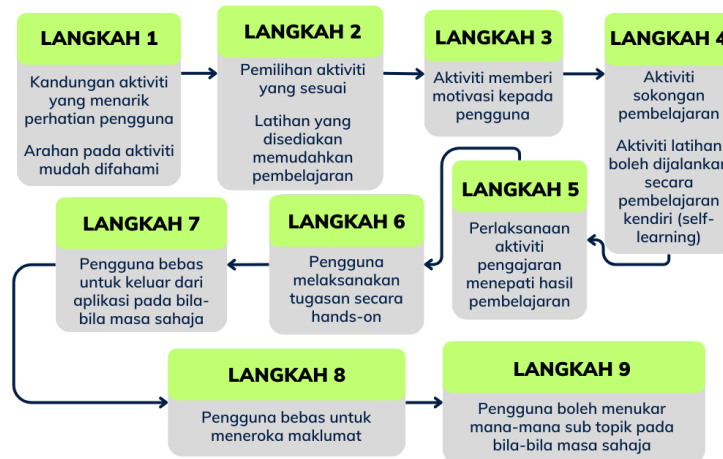
Rajah 6 Model Susunan Pengisian Aktiviti

Konstruk yang terakhir di dalam model My Arabiy Game-X ini adalah konstruk penilaian hasil pembelajaran. Rajah 7 menunjukkan keutamaan yang perlu diberi perhatian oleh pembangun model.