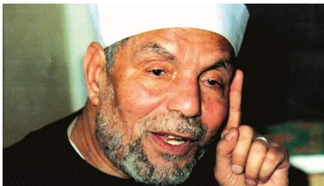
Gambar 1: Shaykh Muhammad Mutawallī al-Sha'rāwī